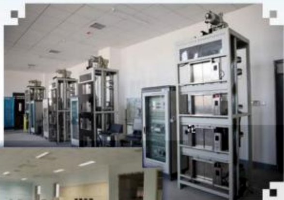
智能电梯安装调试 维护训练场所